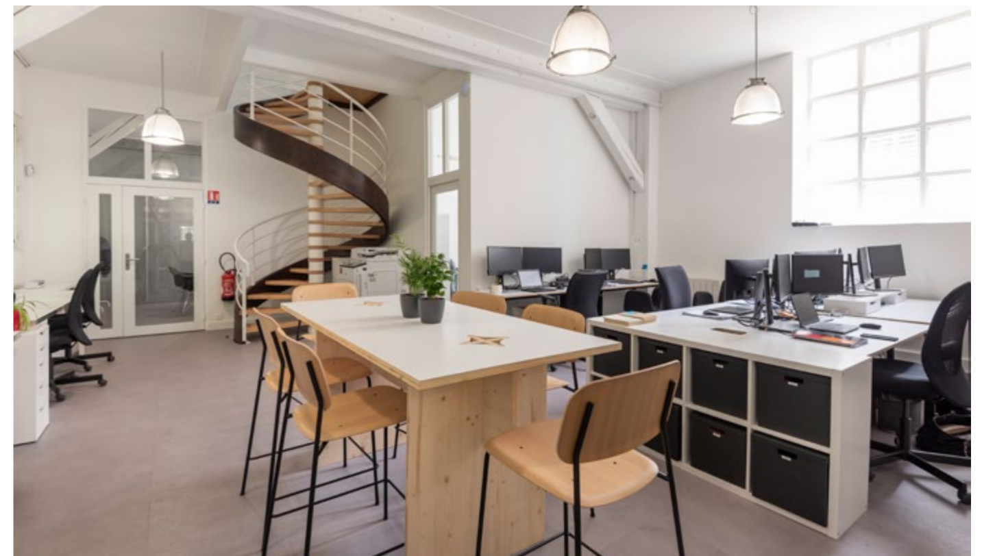
Photo de l'espace proposé