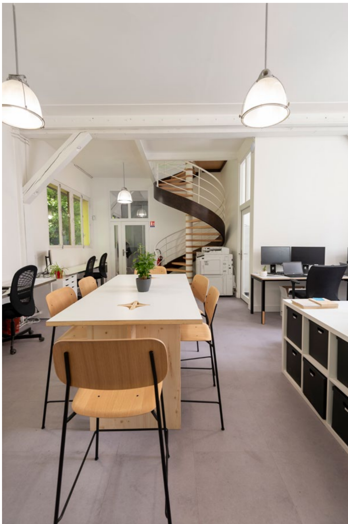
Photo de l'espace proposé