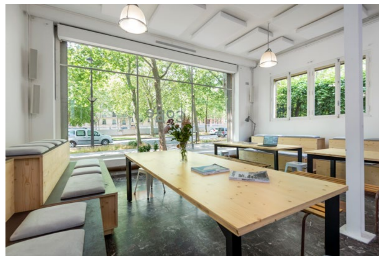
Espace commun sur rue