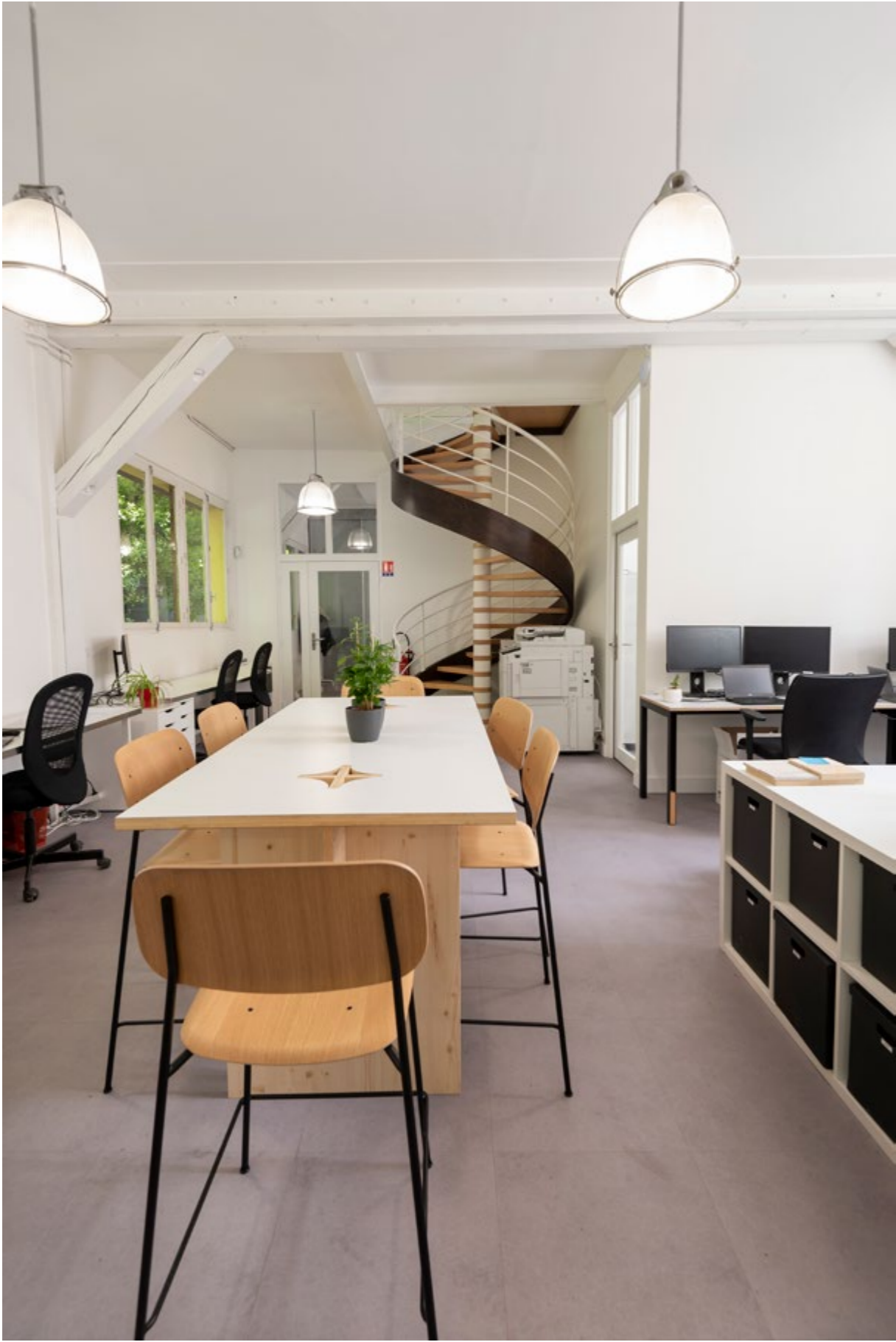
Photo de l'espace proposé