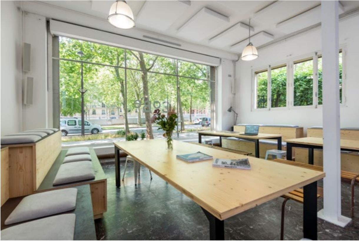
Espace commun sur rue